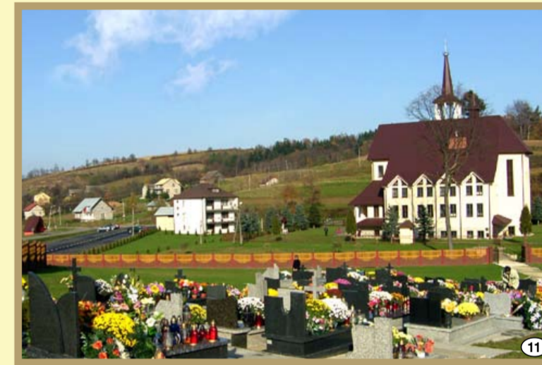
Kamienica Górna - widok na kościół i cmentarz parafialny