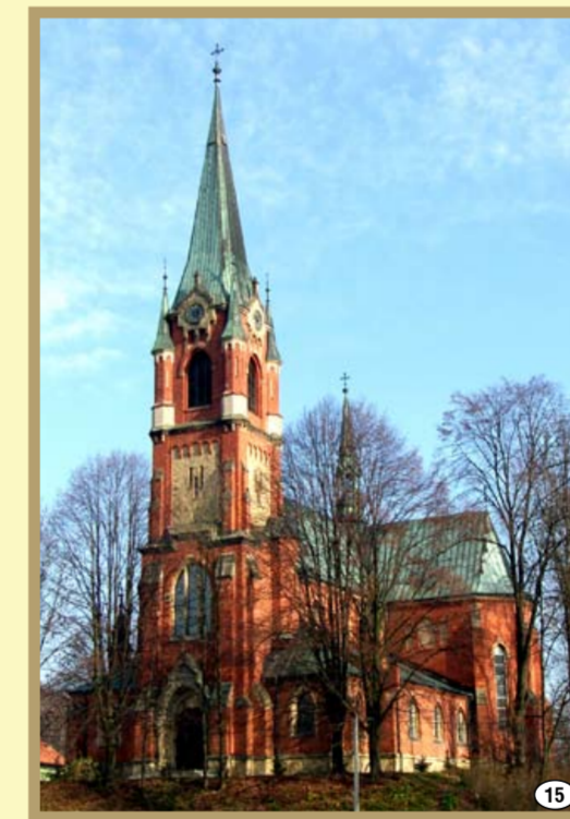
Siedliśka-Bogusz - kościół parafialny