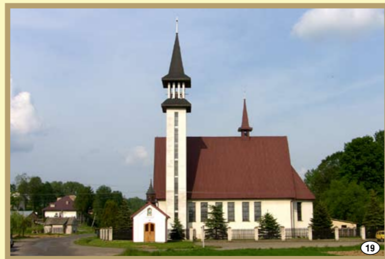
Kościół parafialny w Grudnej Górnej