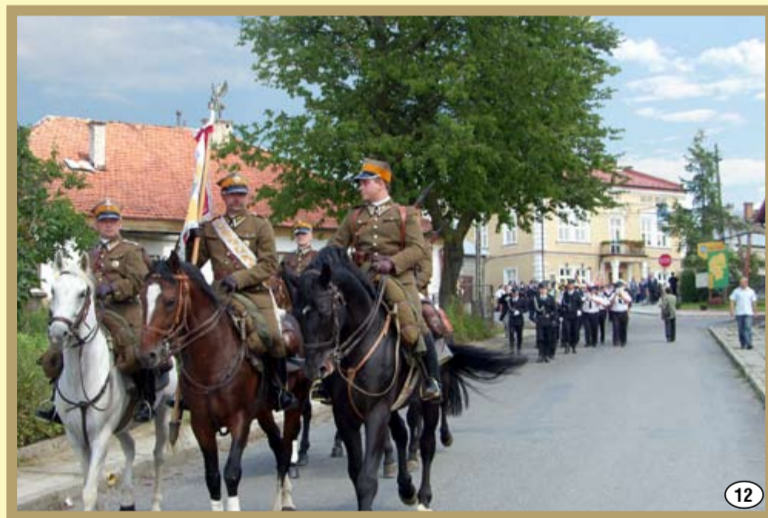
VII Dni Ziemi Brzosteckiej