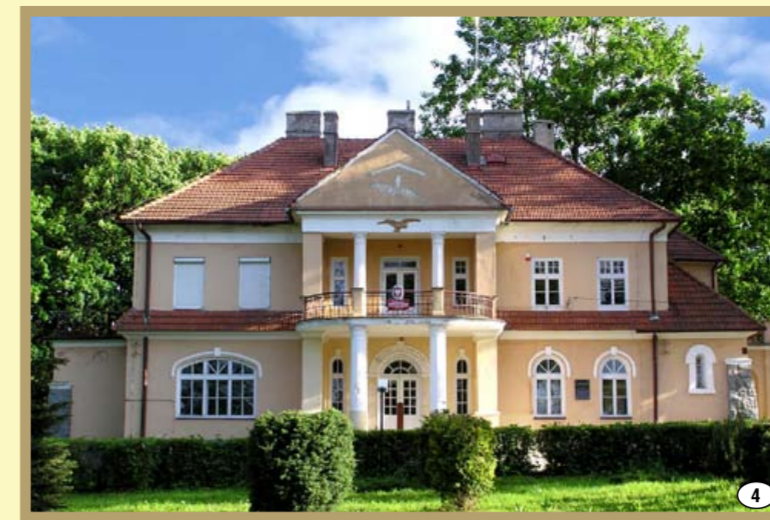
Przeczycza - dwór z końca XIX w.