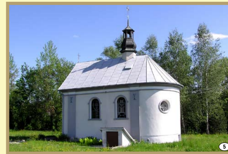
Opacionka - kaplica dworska, obecnie cmentarna (1857 r.)