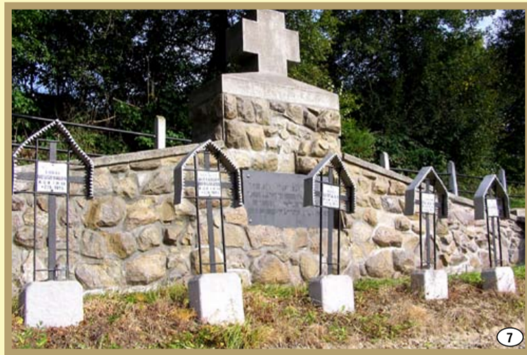
Cmentarz wojenny z I wojny światowej w Bukowej