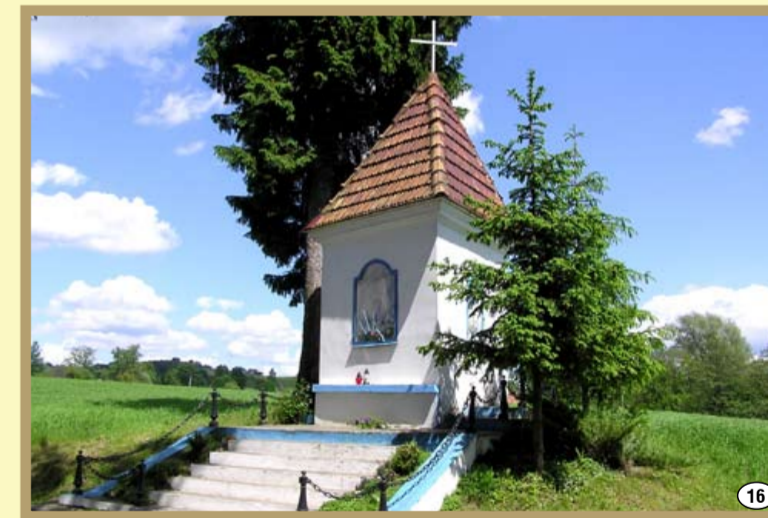
Kapliczka w Globikówie przy drodze do dworu