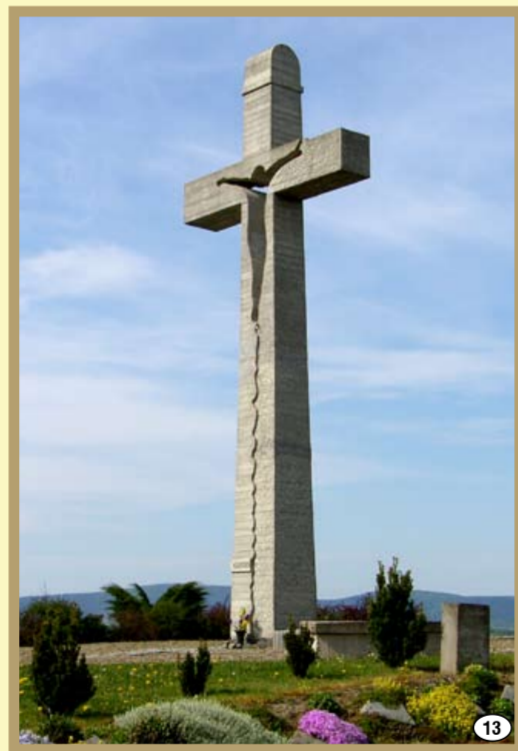
Krzyż Jubileuszowy w Brzostku