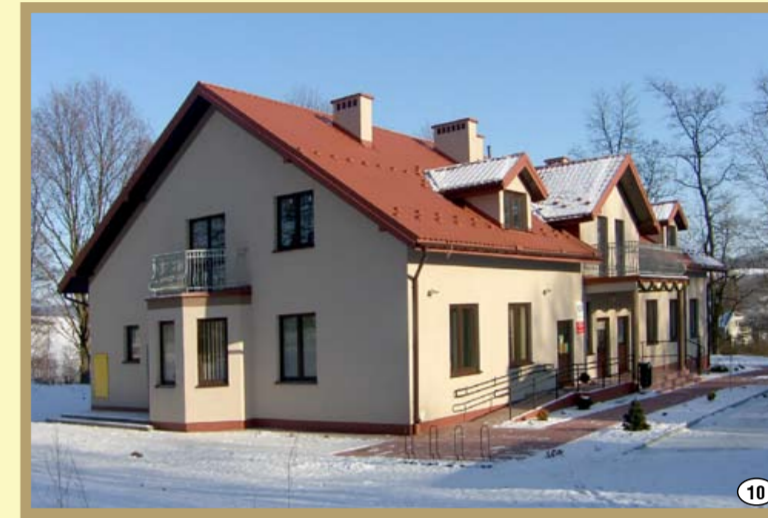
Ośrodek Zdrowia w Smarżowej