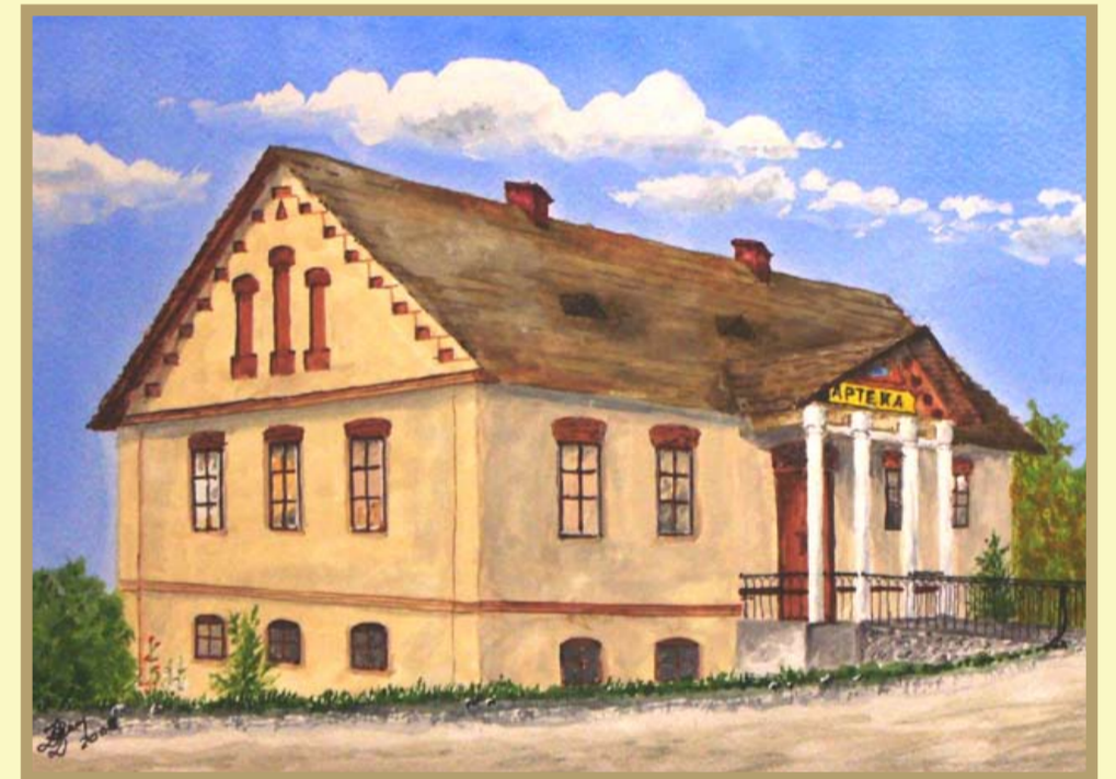
Zbigniew Szeler, Apteka „Pod Opatrznością” wybudowana przez Ignacego Łukasiewicza w 1858 r. w Brzostku, akwarela 2008