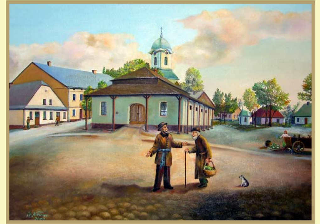
Stanisław Niemiec, Rynek w Brzostku w XIX w., olej 2007