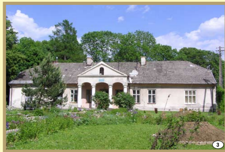
Klecie - dwór z XVIII w.