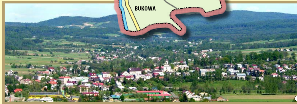
Panorama Brzostku - widok ze Skurowej