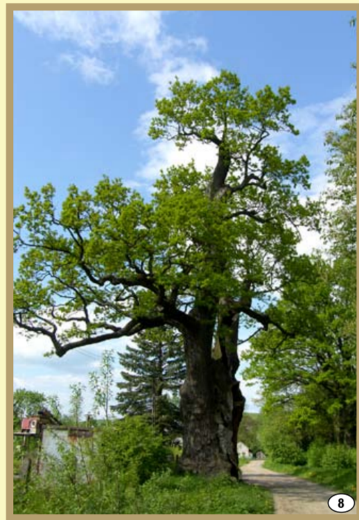
600-letni dąb w Januszkowicach