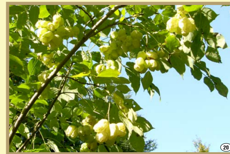
Kłokoczka południowa w rezerwacie „Kamera” w Smarżowej