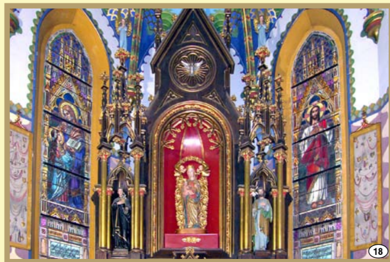
Cudowna Figura Matki Bożej w kościele w Przeczycy