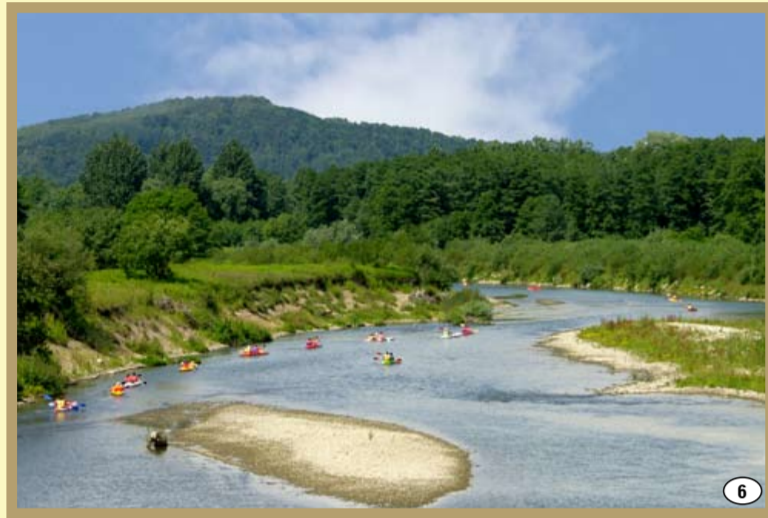
Wisłoka w Kamienicy Dolnej