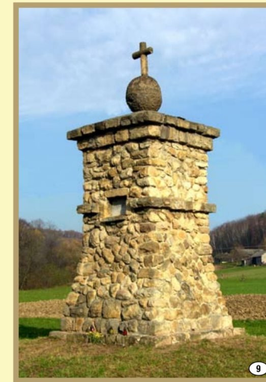
Siedliśka-Bogusz - Pomnik Grunwaldzki