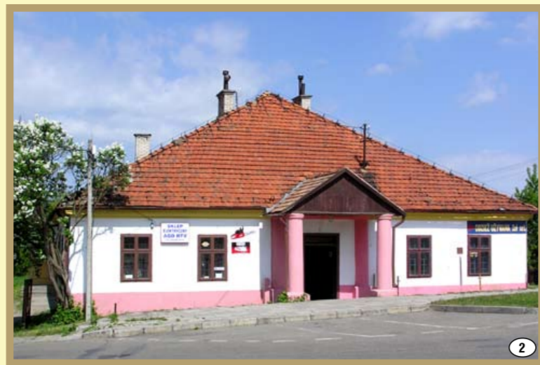
Brzostek - zajazd z końca XVIII w.