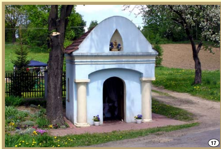
Wola Brzostocka - zabytkowa kapliczka z I połowy XIX w.