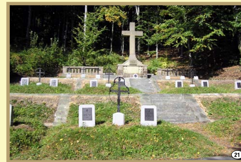
Cmentarz wojenny z I wojny światowej w Zawadce Brzostockiej