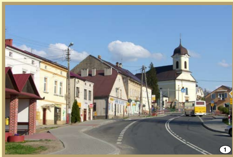
Brzostek - fragment Rynku